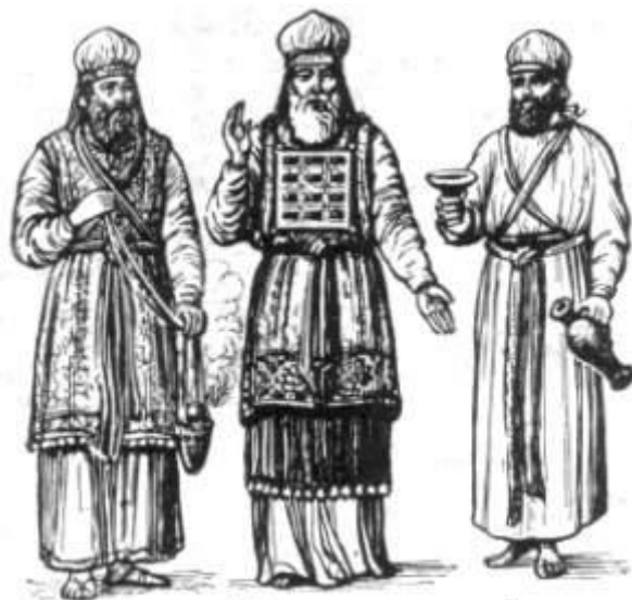
Священник. Первосвященник. Девит

Во времена апостолов, как видно из книги Деяний апостольских, были особенные места для собраний верующих и для совершения Таинства Причащения, называвшиеся церквами, где богослужение совершалось поставленными на то через рукоположение (в Таинстве Священства) епископами, пресвитерами (священниками) и диаконами.